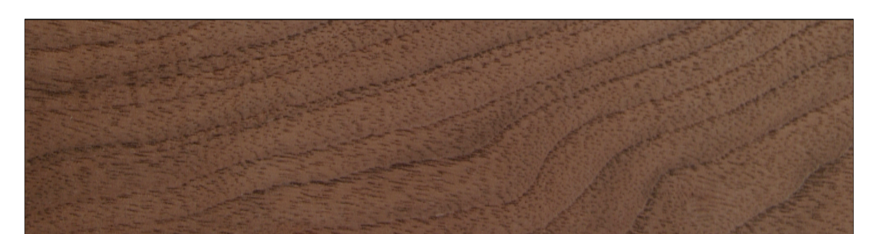
WALNUT _ WALNUSS