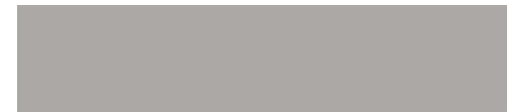
GRIGIO ANTRIM 0752