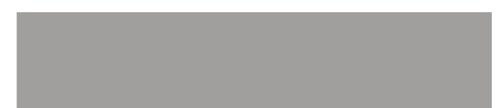
GRIGIO EFESO 0725