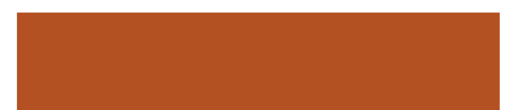
ROSSO NAMIB 0789